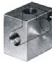
Bloco para ponto